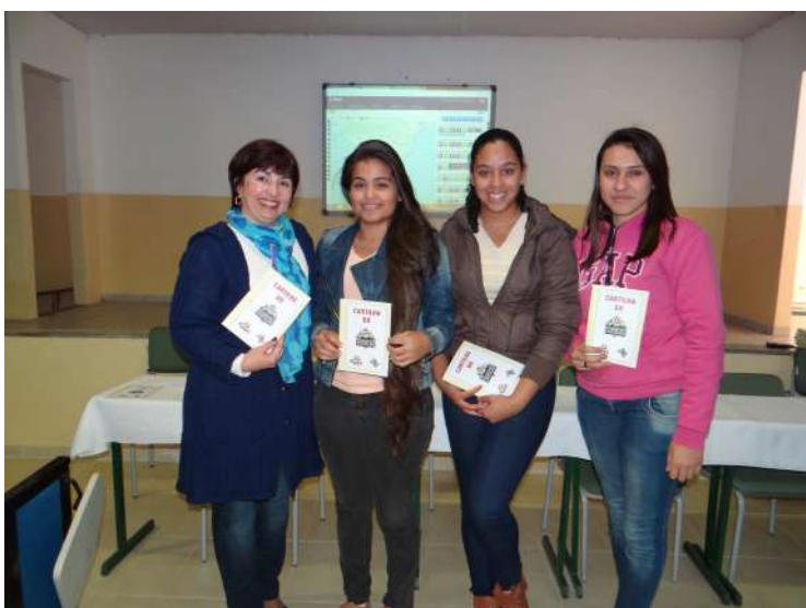
Lançamento da Cartilha do Transporte Escolar

A Secretaria Municipal de Educação fez na última terça-feira, 16 de junho, a apresentação oficial do sistema de rastreamento de veículos pertencentes à frota do transporte escolar.