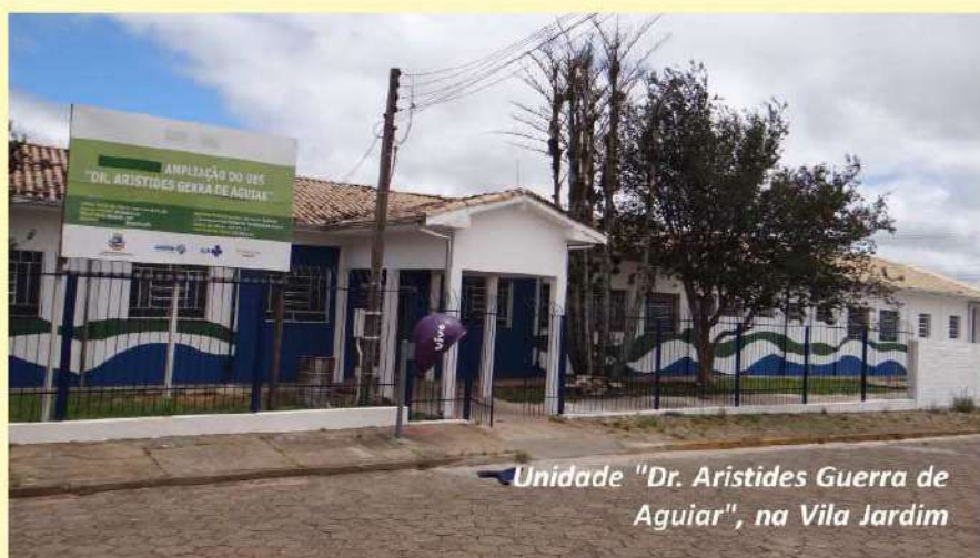
Unidade "Dr. Aristides Guerra de Aguiar", na Vila Jardim

Já a UBS "Dr. Aristides Guerra de Aguiar" (Vila Jardim) ocupava uma área de 371,63 m 2 . Ampliada em 159,80 m 2 a unidade passou a dispor de um Centro de Fisioterapia remodelado, equipado e com acessibilidade. Nas duas obras a Prefeitura investiu mais de R$ 468 mil.