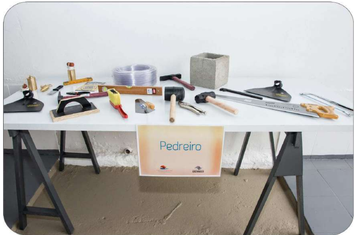
Material utilizado no curso de pedreiro

"A Escola de Construção Civil é mais um projeto inovador no município. Tanto os monitores quanto os alunos irão receber uma bolsa auxílio do projeto, através do Centro Paula Souza. Os cursos estão em alta devido ao crescimento do setor de construção civil", lembram os dirigentes do setor.