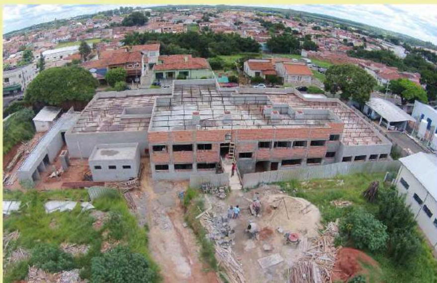
Obra orçada em mais de R$ 3 milhões

Orçada em mais de R$ 3 milhões, a Unidade de Pronto Atendimento (UPA) substituirá o Pronto Socorro quando estiver finalizada. Ela oferecerá serviço de raio X, laboratório para exames, aparelho de eletrocardiograma e atendimento pediátrico. A população poderá tratar problemas como hipertensão, febre, cortes, queimaduras, alguns traumas e receber o primeiro atendimento para infarto ou acidente vascular cerebral (AVC), entre outras enfermidades.