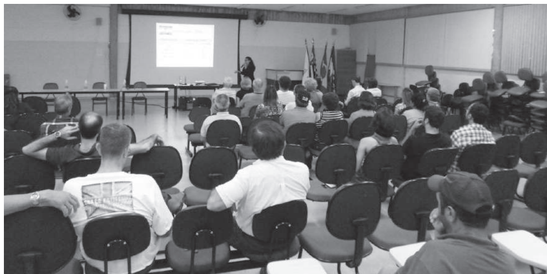
CRÉDITO TEXTO E FOTO: FERNANDO FRANCO AMORIM/COMSEA AVARÉ

Entre outras atribuições, o conselho tem como função principal ser um espaço de articulação entre o governo e a sociedade civil para a formulação das diretrizes e prioridades de construção das políticas públicas e ações na área da segurança alimentar e nutricional da população avareense.