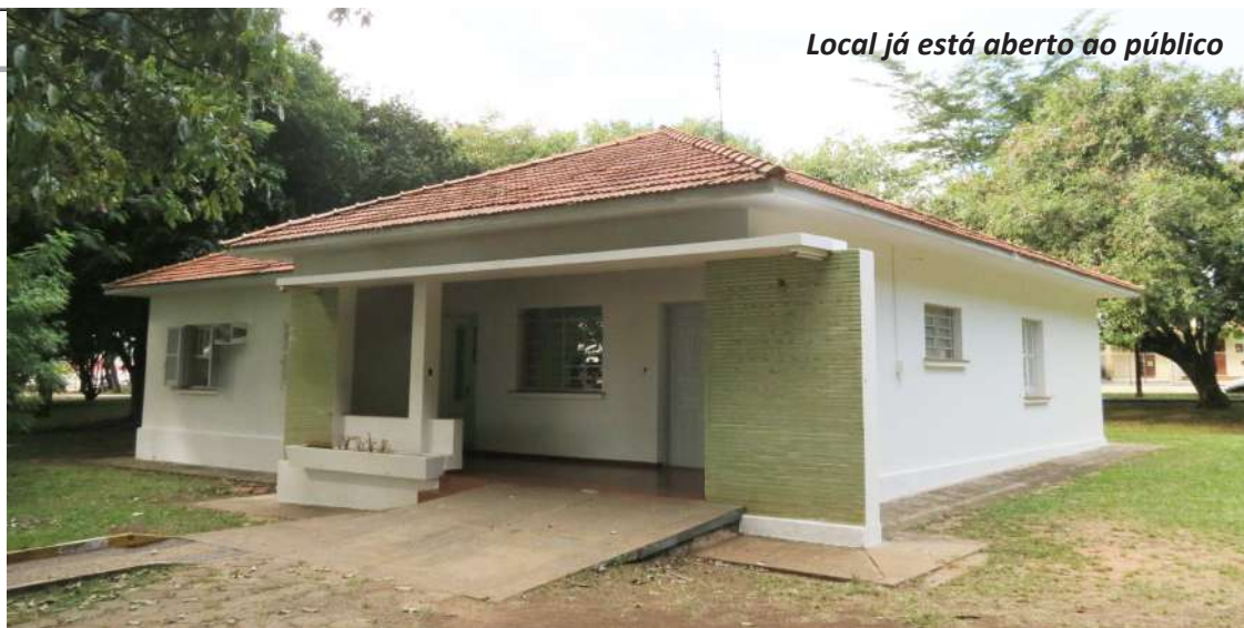
Local já está aberto ao público

CERIMÔNIA - Na noite do dia 29, a partir das 19h30, a abertura da Casa de Cultura obedecerá a seguinte programação aberta ao público: apresentação do novo painel fotobiográfico e de novo folheto do Memorial Djanira; entrega de folhetos da Galeria de Autores Avareenses na Biblioteca Municipal e homenagem ao escritor José Pires