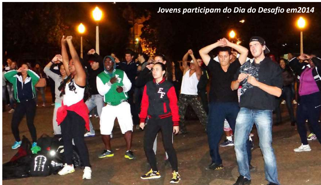
Jovens participam do Dia do Desafio em 2014

Coordenado pelo Sesc, desde 1995, o Dia do Desafio é uma iniciativa da TAFISA - The Association For International Sport for All - conta com o apoio da ISCA - International Sport and Culture Association - e da UNESCO e trata-se de uma realização das prefeituras municipais.