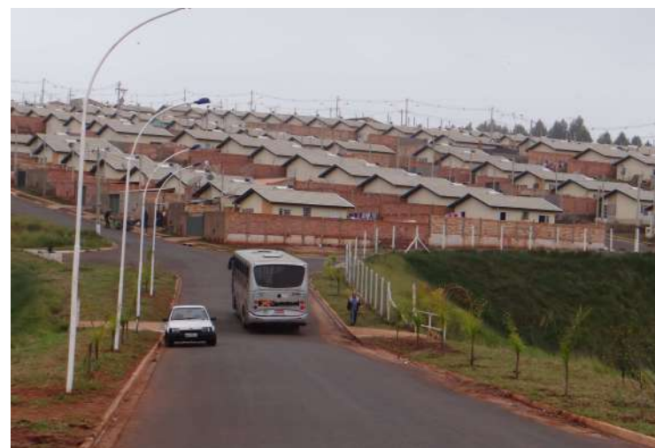
Postes de iluminação instalados na ligação entre o Jd. Paraíso e o Residencial Mário Bannwart

Responsável pela fiscalização de terrenos particulares que necessitem de limpeza e roçada, a Secretaria do Meio Ambiente vem notificando proprietários por meio de correspondência com Aviso de Recebimento (AR). A partir da publicação do referido endereço no Semanário Oficial e do recebimento do AR, o proprietário tem 15 dias úteis para providenciar a limpeza. Se não for executada, a Secretaria de Serviços fará o trabalho e haverá aplicação da multa.