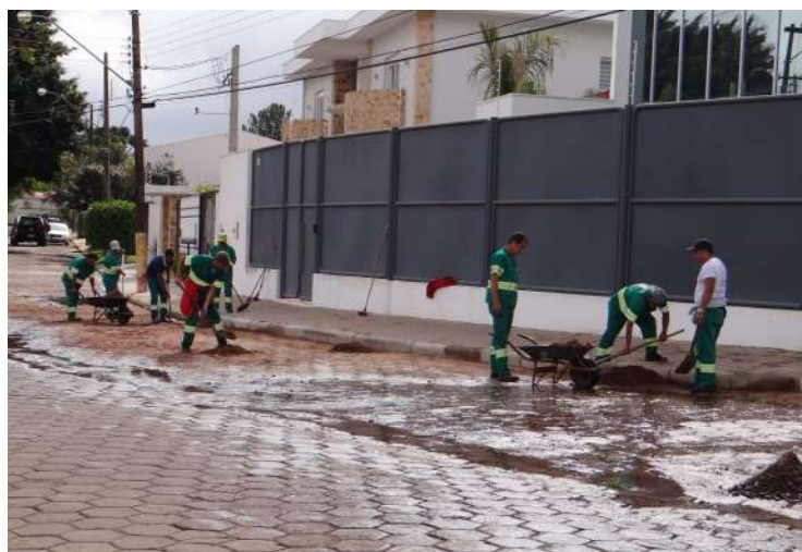
Retirada de terra na Avenida Carlos Ramires

Desde que assumiu oficialmente a manutenção da iluminação pública, a Prefeitura vem executando a troca de lâmpadas, que deve ser solicitada através da Ouvidoria Municipal (3711-2500). No último sábado, 30, foram implantados quatro postes de luz na ponte que liga os bairros Jardim Paraíso e Mário Emílio Bannwart, atendendo a uma solicitação dos moradores.