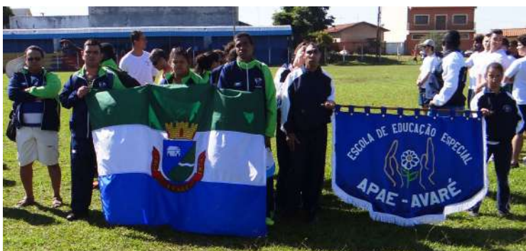
Equipe de atletismo adaptado de Avaré na abertura da etapa avareense do Circuito Especial de Atletismo

frente da equipe de Igarapu do Tietê, com uma diferença de apenas 3 pontos. Na terceira colocação ficou a cidade de Paranapanema, com 153 pontos. Na classificação geral, somando as etapas de Avaré e Itai, os avareenses lideram o circuito com 220 pontos, dez pontos à frente de Paranapanema.