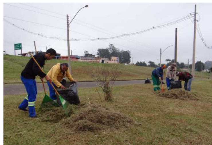
Roçadas em canteiros, áreas verdes e terrenos particulares