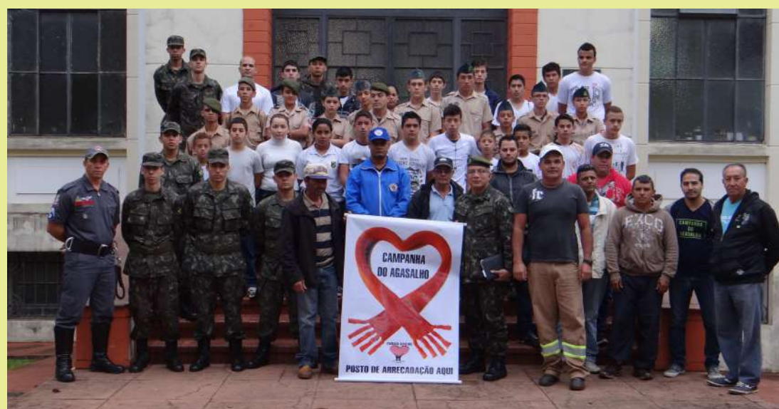
Voluntários reunidos para o mutirão da campanha

A zona urbana foi dividida em setores para favorecer a chamada operação porta a porta. Os números serão divulgados na próxima semana, após a contagem geral das peças.