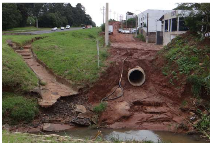
Tubulação implantada na avenida marginal da SP 255

Executada em convênio com o Governo do Estado, através da Secretaria de Planejamento e Desenvolvi-