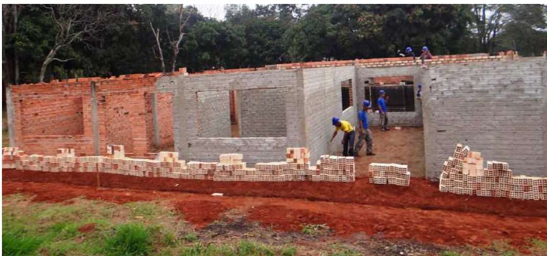
Operários atuam na parte de alvenaria da obra

Prefeitura vai finalizar a obra aguardada há anos pelos moradores. Investimento será de R$ 566 mil. Outros postos em construção no Paraíso, Plimec, Paineiras e Santa Elizabeth vão reforçar o atendimento da rede básica de Saúde nos bairros da cidade.