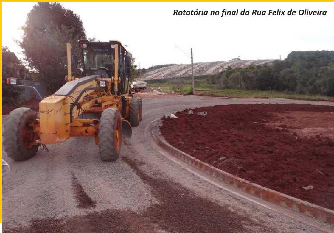
Rotatória no final da Rua Felix de Oliveira